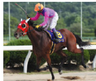
2007年 ナンブラッキーワン