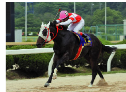
第50回 九州ダービー栄城賞 2008年6月1日(日) 佐賀競馬場 2,000m オリオンザナイト

佐賀競馬場の2000メートルは2コーナーのポケットからスタートして馬場を1と3/4周するコース。過去5回のうち3回で逃げた馬が勝利しているが、残り2回は、後方追走から3コーナーでマクって勝利している。ただゴールまでの直線200メートルは地方競馬場でも短い部類に入るだけに、4コーナーで3〜4番手くらいにはつけられないと厳しい。なお過去5回とも逃げ・先行馬と、差し・追い込み馬の組み合わせで決着しているのは面白い。