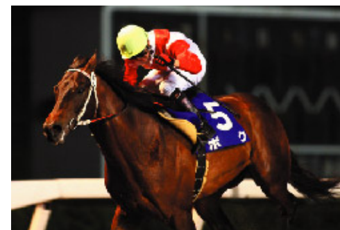
第36回 北海優駿 2008年6月3日(火) 旭川競馬場 1,600m ボク

門別競馬場の2000メートルで行われた過去3年(1998、01、02年)では、連対した6頭のうち、4頭が8番枠より外に入っていた。小回り・平坦コースの旭川競馬場で行われた過去2年は、ともに逃げ・先行馬による決着となったが、今年は門別競馬場での実施。ゴールまでの直線が330メートルと地方競馬場では大井競馬場に次ぐ長さを誇る、広いコースに替わるだけに、差し馬の台頭も十分に考えられる。