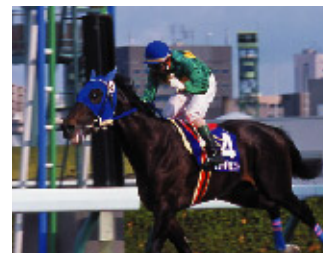
2006年 フジノダイヒット