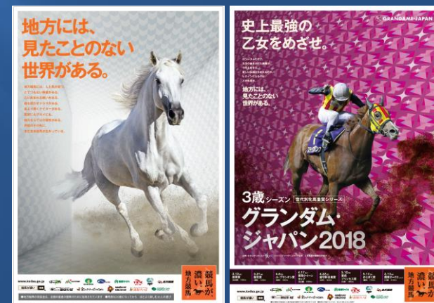
ブランドポスター シリーズポスター